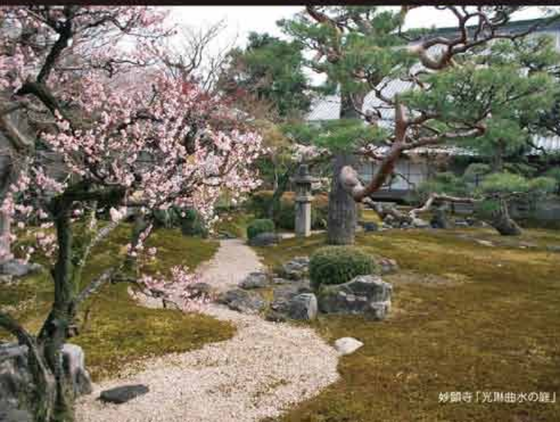
妙顯寺「光馬曲水の庭」