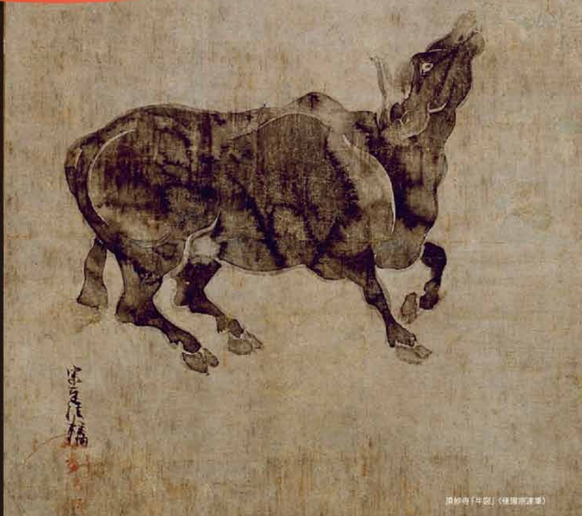
頂妙寺「牛図」(徳川宗達筆)