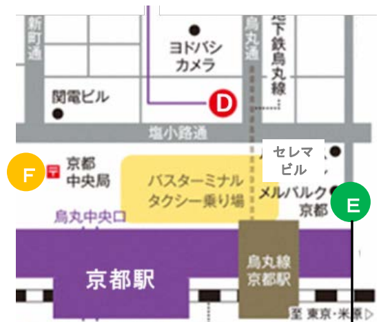
メルパルク京都 京 KOKO Welcome Center